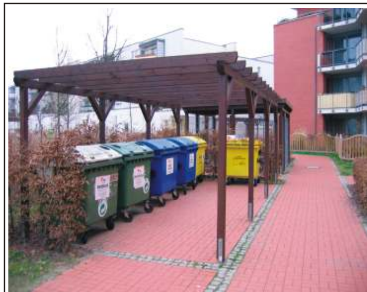
Místa, kde stojí na sídlišťích kontejnery na odpad budou hezčí a bezpečnější. Vedení radnice se nechává inspirovat v Německu, kde kontejnery zakrývají pergoly s rostlinami. První úpravy kontejnerových stání v našem obvodě jsme začali v ul. Jizerská.