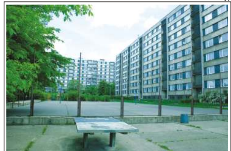
K nepoznání se promění hřiště mezi Glenovou a Gagarinovou ulicí. Zmizí betonová plocha, kterou nahradí víceúčelové hřiště a provazové prolézačky.

Na akci s rozpočtem přes milion korun shání radnice dotaci. Vedle U-rampy