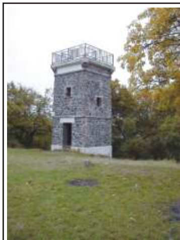
Současnost: Erbenovu vyhlídku tvoří nyní jen kamenná část.

„Žijeme v 21. století a neměli bychom proto stavět jako před více než sto lety. Ve světě je běžné, že moderní