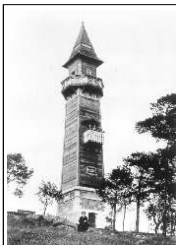
Minulost: Erbenova vyhlídka se svou původní přístavbou na konci 19. století. Dřevěnou nástavbu dvakrát shodil vítr.

Budoucí podoba Erbenovy vyhlídky se v posledních měsících stala jedním z nejdiskutovanějších témat na Severní Terasě i v celém Ústí nad Labem. Bojuje se na více frontách. Proti sobě stojí dva renomovaní architekti. Klub českých turistů zase začal bojovat o svých představách o budoucí vyhlídce s obvodní radnicí. Přitom vlastně vůbec žádné rozhodnutí o podobě nástavby nepadlo a veškerá jednání neskončila, jistá je jen jediná věc: Erbenova vyhlídka dostane nástavbu na základě návrhu pražského architekta Libora Čížka.