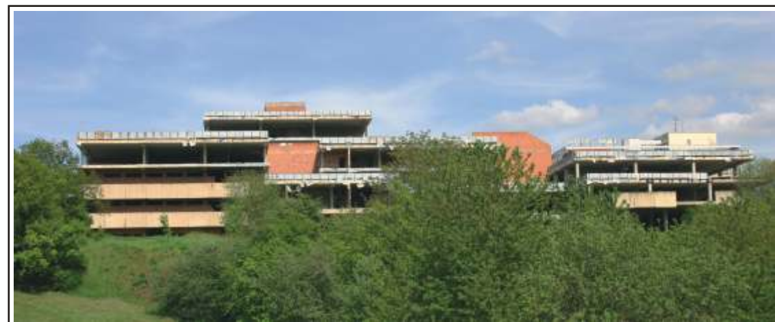
Chátrající ruina hyzdí okolí Severní Terasy. Sektorové centrum mělo být chloubou obvodu, ve které mělo být multifunkčním zařízením pro místní obyvatele. V současné době vede radnice spor o vlastnictví objektu. Proto už přes deset let se na staveništi nepracuje.

na 40 - 50 mil. korun a na dostavbu okolo 200 mil. korun. Na dostavbu ale vedení radnice nemá finanční prostředky, ale v případě odstranění stavby existují už plány na výstavbu rodinných domů na ploše 16 000m 2 . Vzhledem k lokalitě v těsném sousedství centra by určitě o pozemky byl obrovský zájem.