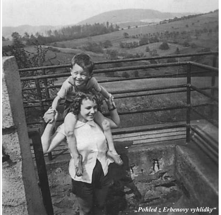
„Pohled z Erbenovy vyhlídky“

„Severní Terasa, ač má přes 22 tisíc obyvatel, neměla přirozené centrum - náměstí, kde by se lidé scházeli. Kdysi bylo uměle vytvořeno v prostorech dnešního garážového stání poblíž supermarketu Delvita. Místo, které nebylo nikdy pro tyto účely využíváno, je dnes opuštěné a my hledáme investora, který by ho pomohl oživit. Postupně se centrem obvodu stal právě park. Obyvatelé se tu scházejí, odpočívají, děti tu mají místo na hrani,“ dodává místostarostka Kovaříková.