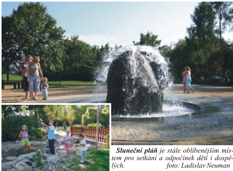
Sluneční pláň je stále oblíbenějším místem pro setkání a odpočinek dětí i dospělých.

Uprostřed Severní Terasy vznikl odpočinkový areál, který nemá v Ústí nad Labem obdoby. Lidé mohli v Centrálním parku odpočívat na vypůjčených lehátkách, děti si hrají v novém potoce nebo kašně. Vzniklo tu i lapidárium plné soch.