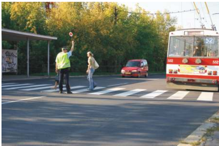
Bezpečnému pohybu chodců po přechodech napomáhají strážníci zejména v ranní špičce v blízkosti škol a školek.

„Z osobní zkušenosti vím, že mnohem lépe se třídí odpad, když ke kontejneru nemáte daleko. Velké vzdálenosti, které musíte s odpady absolvovat, jsou demotivující. Věřím, že v našem obvodu začne třídít mnohem více obyvatel,“ dodává starosta.