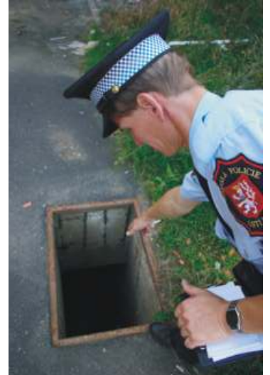
Vandalové ničí zábrany na několik metrů hlubokých nebezpečných jámách v celém areálu staveniště. Pohyb areálem je tak zvlášť v nočních hodinách životu nebezpečný.