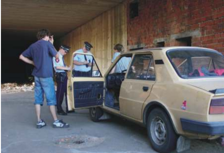
Téměř denně řeší strážníci nedovolený vstup zejména dětí, mladistvých a bezdomovců na staveniště sektorového centra.

„Ani nové oplocení nebrání tomu, aby se do rozbořeného areálu dostávali lidé. Ideální by byla kompletní demolice. Myslím, že je jen otázka času, kdy na ni dojde,“ říká starosta obvodu Jiří Brodský. Nejvíce se diskutuje možnost využít pozemky spolu s okolím na stavbu vilové čtvrti nebo tu postavit domy s více byty.